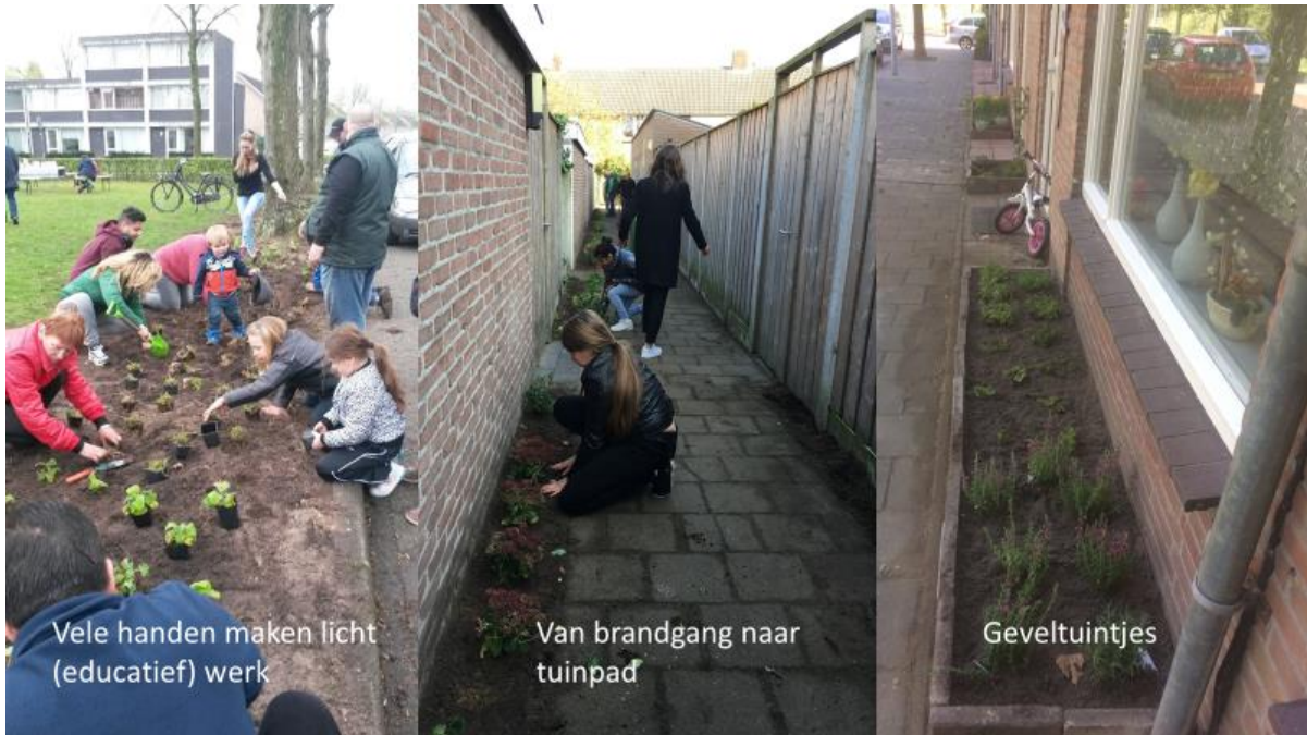
Vele handen maken licht (educatief) werk